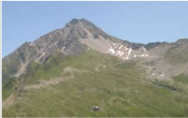
Der Gipfel, die Edel-Hütte, das Föllenbergkar.

Region: Zillertal Zusammenfassung: Alpine Tour auf einen unglaublich schönen Aussichtsgipfel Talort: Mayrhofen Ziel: Ahornspitze, 2973m Ausgangspunkt: Hahnpfalz, 1960m, Bergstation der Ahornseilbahn, Parkplatz