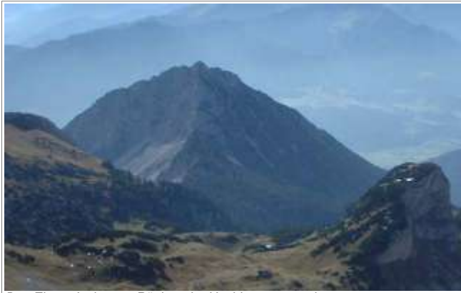
Das Ebner Joch, vom Rücken der Hochiss aus gesehen.