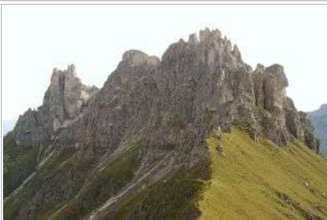
Der Elferstock von "hinten" - vom Zwölfernieder.