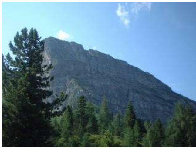
Der Gerlosstein trägt seinen Namen schon zu recht. Gut, dass wir nicht von dieser Seite hoch müssen...