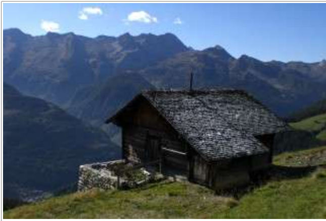
An der Gerlostalalm.