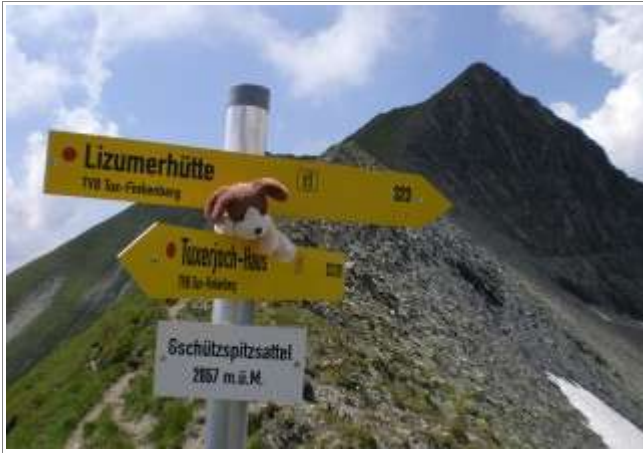
Wegweiser am Gschützspitzsattel.