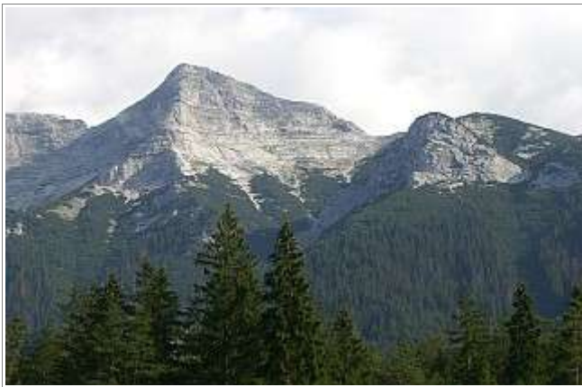
Der Guffert ist all seiner pyramidalen Pracht.

Region: Achenal Zusammenfassung: Alpine Tour auf einen unglaublich schönen Aussichtsgipfel Talort: Steinberg am Rofan Ziel: Guffert, 2194m Ausgangspunkt: Vordersteinberg (Unterberg), gebührenpflichtiger Parkplatz bei Gasthof Waldhäusl (Kleingeld mitbringen!)