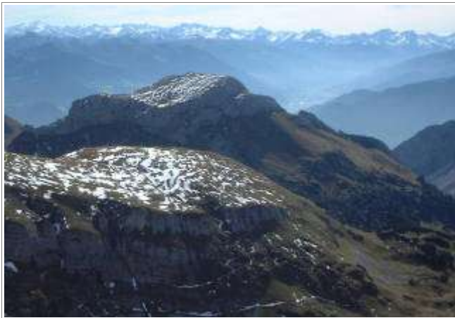
Die Haidachstellwand (hinten).