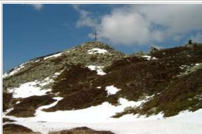
Am Gipfelaufbau des Hamberg.