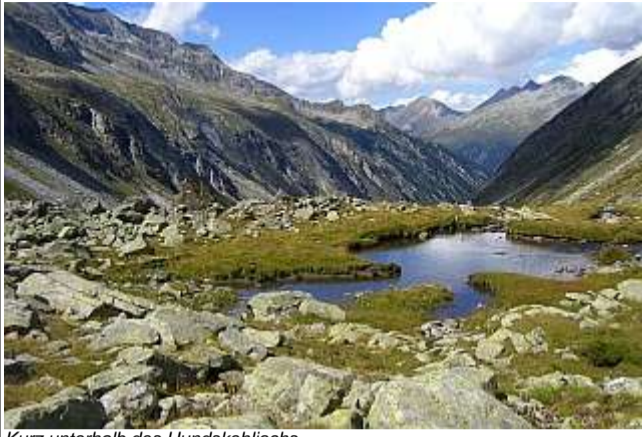
Kurz unterhalb des Hundskehljochs.