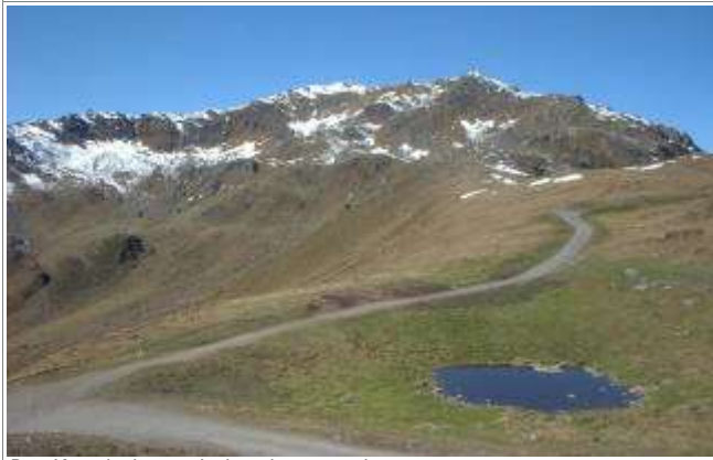
Das Kreuzjoch, vom Isskogel aus gesehen.