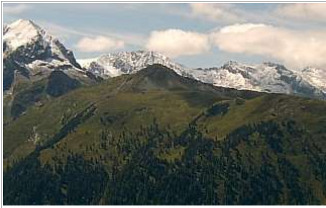
Ein kleiner Gipfel umgeben von hohen Gipfeln...