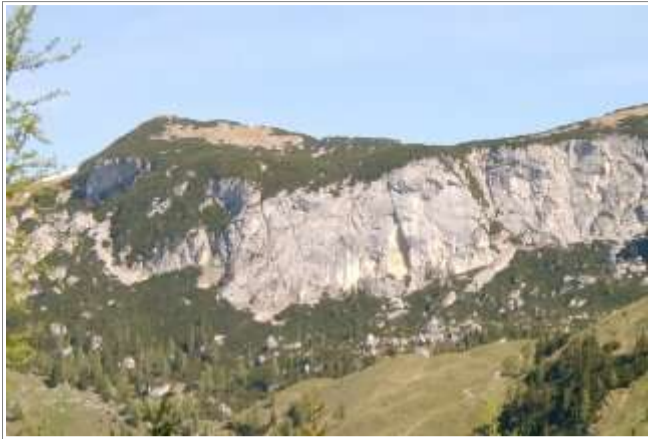
Das "zerklobene" Joch. Naja, von oben jedenfalls.