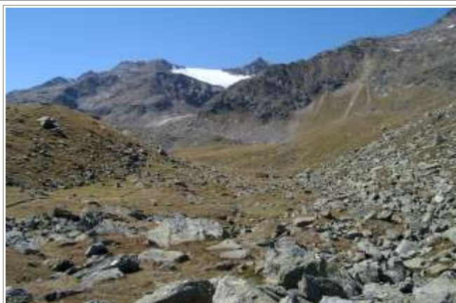
Blick ins Lehnerkar, mit dem Lehnferner.