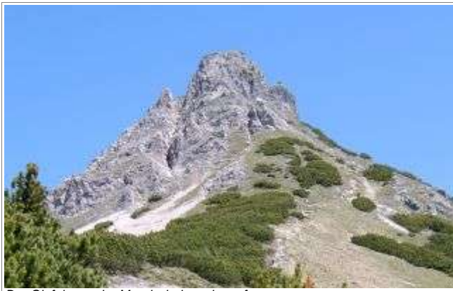
Der Gipfel, aus der Mondscheinsenke aufgenommen.