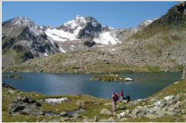
Der Mutterberger See hat sogar zwei kleine Inseln.