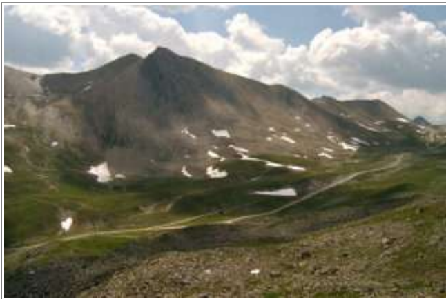
Der Pezid, darunter das Lader Moos.