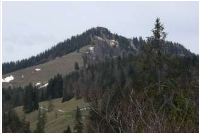
Der Rabenkopf von der Walchenalm aus.