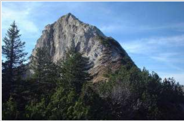
Die Rappenspitze in ihrer ganzen Pracht.