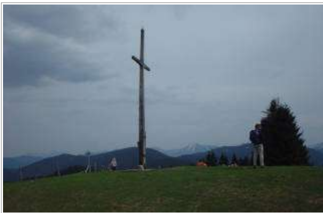
Könnte überall sein, ist aber am Gipfel des Rechelkopfs.