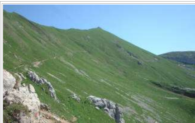
Schlussanstieg zur Rofanspitze.

Region: Achantal Zusammenfassung: Hübsche, teils anspruchsvolle Ost-West-Durchquerung des Rofangebirges Talort: Maurach am Achensee Ziele: Rofanspitze, 2259m; Zireiner See, 1799m Ausgangspunkt: Erfurter Hütte, 1831m, bei der Bergstation der Rofanseilbahn. Parkplätze an der Talstation.