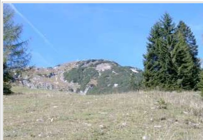
Der Gipfel im Anstieg... noch ein Stück weit weg.