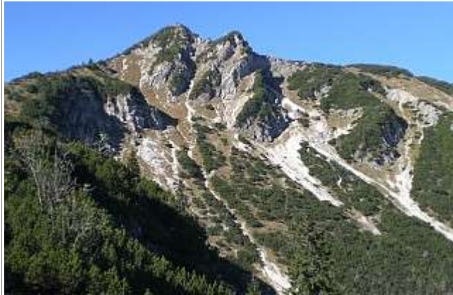
Der Gipfel von der Trausnitzalm aus.

Region: Wendelsteinregion (Mangfallgebirge)