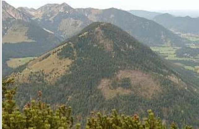
Der Seebergkopf von Osten, links die Neuhüttenalm.

Region: Wendelsteinregion (Mangfallgebirge) Zusammenfassung: Abwechslungsreiche Besteigung eines "kleinen" Gipfels Talort: Bayrischzell Ziel: Seebergkopf, 1538m Ausgangspunkt: Parkplatz "Seeberg" an der B307 am Ortsrand von Bayrischzell, 800m.