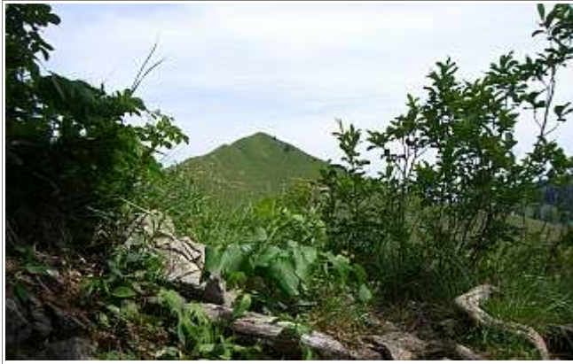
Ein erster Blick vom Weg aufs Seekarkreuz..