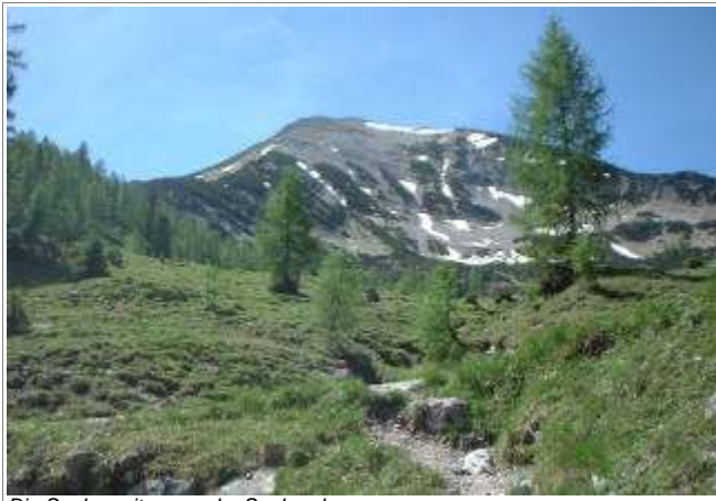
Die Seekarspitze von der Seekaralm.