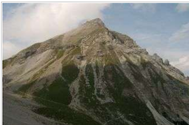
Die Serles von Süden.

Region: Stubaital/Wipptal Zusammenfassung: Gemäßigter alpiner Aufstieg auf einen markanten Gipfel Talort: Matrie am Brenner Ziel: Serles, 2717m Ausgangspunkt: Kloster Maria Waldrast, von Matrie aus auf schmaler, aber guter Mautstraße (ca. 4 Euro) erreichbar; Parkplatz.