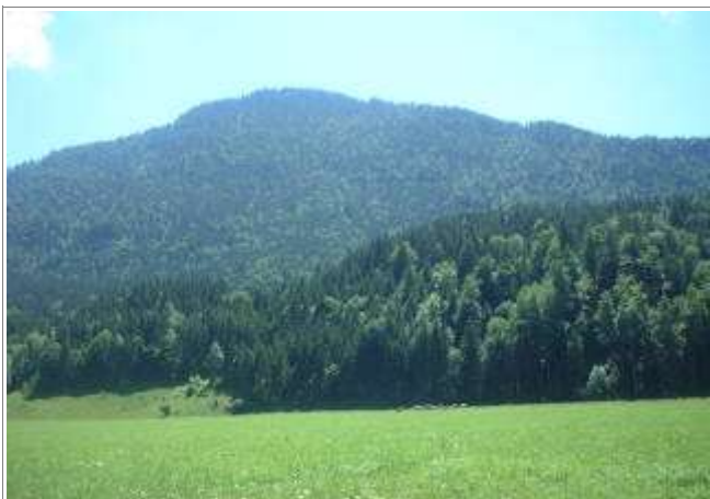
Der/die/das Staffel. Sieht so harmlos aus (und ist es auch).