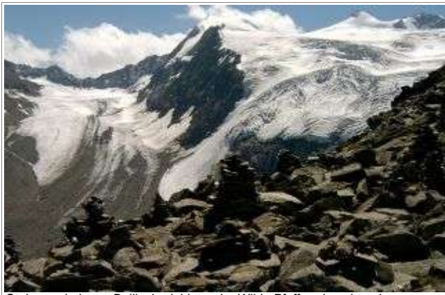
Steinmanderln am Beiljoch, dahinter der Wilde Pfaff und, rechts, das unscheinbare Zuckerhüt.