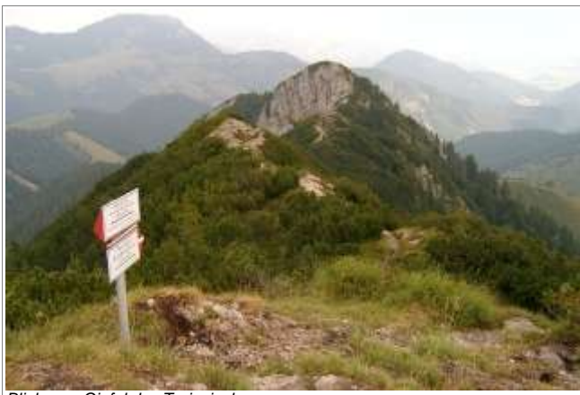
Blick vom Gipfel des Trainsjoch.