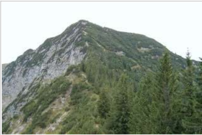
Der Kleine Traithen vom Vogelsang aus.

Region: Wendelsteinregion (Mangfallgebirge) Zusammenfassung: Abwechslungsreiche, teils rassige Gipfelwanderung Talort: Bayrischzell Ziel: Kleiner Traithen, 1723 m. Ausgangspunkt: Gasthof Rosengasse, Parkplätze nahe des Gasthofs am Ende einer schmalen, aber gut befahrbaren Stichstraße der Sudelfeldstraße, 1125m.