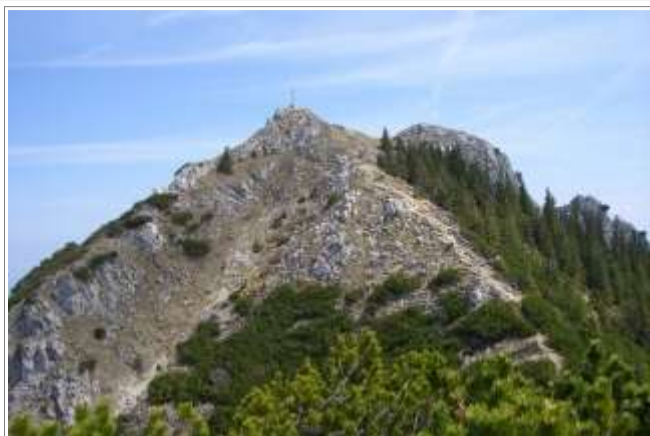
Das Wildalpjoch von Westen.