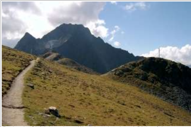
Rechts der Gipfel des zahmen Wetterkreuzkogels - mit Blick auf den Acherkogel.